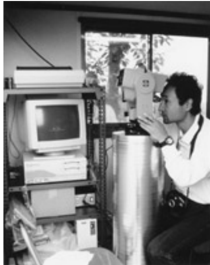
写真8 眉山観測のための自動連続光波測距システム。左の棚に、システム制御のためのパソコンが設置されています。1991年5月11日撮影。

一方、次の記事は、よく調べもしないで、憶測でしゃべった先生の話です。「ドイツの大衆紙ノイエプレッセは、シュツットガルト大学のシック教授の話